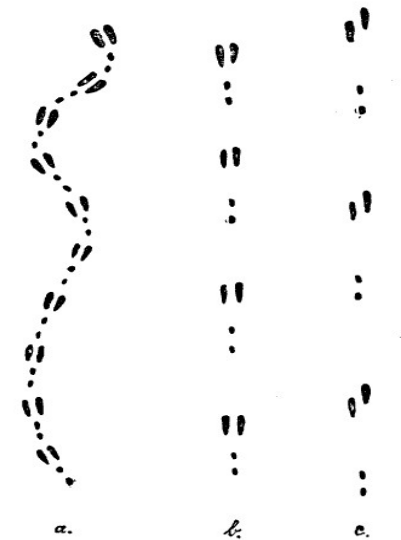
Spur eines Hasen

Das wollen wir – Familien und Kinder - am 22.01.2017 versuchen und uns in die Geheimnisse der Spurenwelt einarbeiten.