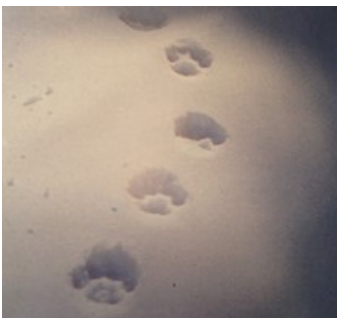
Was ist das für eine Spur?