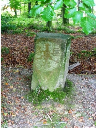
Adlerstein in der Nähe des Landgrabens

Vom Parkplatz der Gaststätte Waldschenke an der Lütticher Str. in Aachen wandern wir durch den Preußwald vorbei am Fernmeldeturm „Mulleklenkes“ entlang des Aachener Landgrabens mit seinen Adlersteinen zum Dreiländerpunkt (D, NL, B). Von dort geht es weiter durch ein von Wald- und Feldgehölzen strukturiertes Offenland zum Türmchen Beeck – einem Wachturm des Aachener Reiches – und schließlich durch Hohlwege vorbei am Forsthaus Adamshäuschen zurück zur Waldschenke, wo wir uns bei Kaffee und Kuchen erholen können.